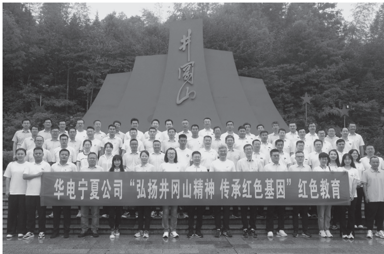
▲中国华电集团有限公司宁夏分公司开展红色教育

抓好思政工作的核心点，重点抓领导干部这一“关键少数”。公司党委突出加强领导干部思想作风和工作作风建设，切实把“软指标”变为“硬约