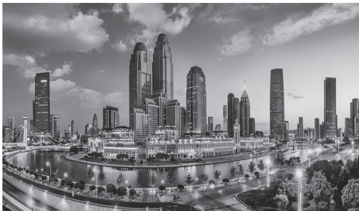
▲天津市和平区夜景

学习贯彻习近平文化思想是当前和今后一个时期宣传思想文化战线的重大政治任务，要在这样的政治定位中深学细悟、融会贯通，推动习近平文化思想的学习走深走实。一是要站在坚定拥护“两个确立”、坚决做到“两个维护”的政治高度来深刻领会和把握。习近平文化思想深刻回答了新时代我国文化强国建设举什么旗、走什么路、坚持什么原则、实现什么目的等根本问题，是习近平新时代中国特色社会主义思想的文化篇，要自觉在增强“四个意识”、坚定“四个自信”、做到“两个维护”的高度上加强对习近平文化思想的学习、研究和阐释。二是要站在“强国建设、民族复兴”的战略高度深刻领会和把握。党的二十大擘画了全面建设社会主义现代化国家、以中国式现代化全面推