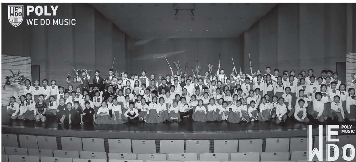
▲保利WeDo童声合唱团赴国外参加国际合唱节比赛

习近平总书记对宣传思想文化工作作出重要指示强调，要强化政治担当，勇于改革创新，敢于善于斗争，不断开创新时代宣传思想文化工作新局面。中国保利集团有限公司（以下简称“保利集团”）作为唯一以文化艺术经营为主业的中央企业，牢牢把握宣传思想文化工作对党和国家事业全局的极端重要性，在深刻领会习近平文化思想中把握稳发展航向，在繁荣壮大文化产业中争当产业链“链长”，在担当新时代新的文化使命下勇于示范表率，守正创新、汇聚力量，为建设社会主义文化强国作出新的贡献。