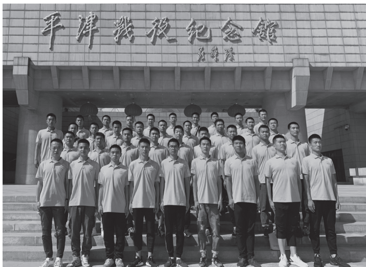
▲作者（第一排左三）参观平津战役纪念馆

经过三年半军事化的学校生活，我顺利地进入军营，成为一名合格的士兵，圆了儿时的梦想。进入部队后，身份也由此转变，从学生到军人，是一个华丽的转身。在五年军事生涯中，我明白了许多事情，成长了许多，收获了很多。第一要守纪律和担责任。军队要有纪律和责任，遵守纪律、承担责任和准时完成任务，让我更加有担当，能够为祖国贡献、为社会造福，为人民服务、为国防献身，同时也能被人民所尊敬。第二要加强团队合作。军队强调团队精神，集体利益大于个人利益，个体需要服从集体，才能使这个团体更加牢固。所以士兵们相互依赖、协作和支持。几年的当兵生涯，让我学会与不同背景和性格的人合作。第三要注重体能训练。通过参与晨跑、军事训练和体能测试，让每个士兵提高身体素质、增强耐力和力量，为建设世界一流军队提供前提保证。在军队中，时常会有突击检查，查看士兵们的状态，要做到随时拉得出、跑得快，只有这样才能打胜仗。第四要不断提升自我。参军的经历为我提供了自我提升的机会，不仅学习了理论知识，同时也加强了实践锻炼，提高了自己各方面的能力，如武器操作、战术训练、医